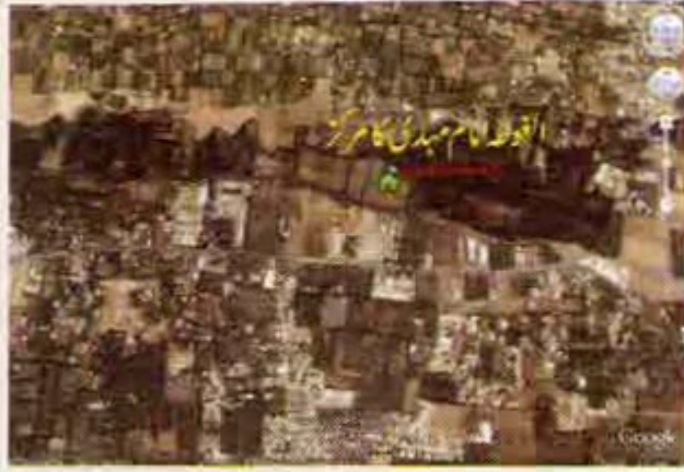
مقام (عالمی جنگ) میں یہ علاقہ امام مہدی کا مرکز ہوگا جہاں سے آپ تمام محاذوں کی کمانڈ کریں گے۔ یہ سٹیٹلائٹ تصویر ہے۔