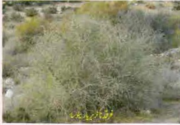
نورقہ باکسیر یا لاکسیم