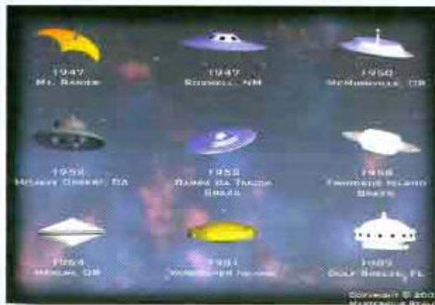
یہ اڑن طشتریوں کی مختلف قسمیں ہیں