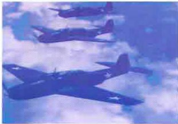
برمودا ٹکون میں غائب ہونے والے جہاز