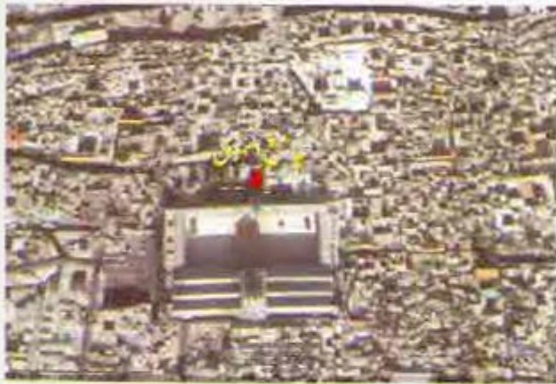
یہ جامع اموی کی سٹیٹلائٹ تصویر ہے۔ جہاں سیدنا عیسیٰ علیہ السلام و جال سے قتال کرنے کے لئے آسمان سے اتریں گے۔