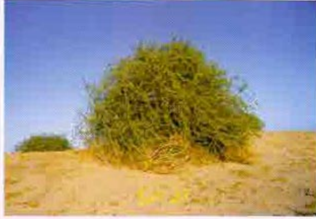
انگلش میں اسکو باکس تحرون کہتے ہیں جبکہ اسکا علم نباتات میں اسکا نام لاکسیم ہے۔